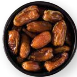
DÁTILES 10 KG