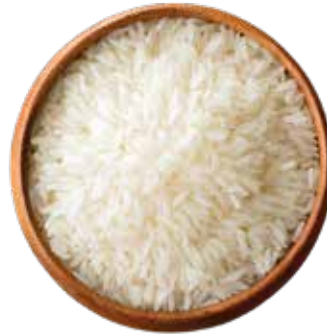
ARROZ JAZMÍN 25 KG