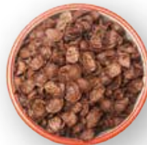
CEREAL EXTRUIDO CHOCO KONG 10KG