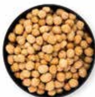
MANÍ CROCANTE TIPO JAPONÉS RECUBIERTO DE AJONJOLÍ 10 KG