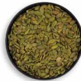
SEMILLA DE CALABAZA VERDE TOSTADA 10 KG