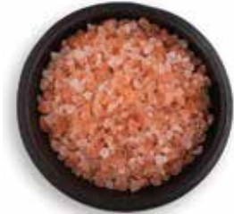
SAL ROSADA DEL HIMALAYA GRANULADA 25 KG