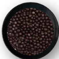
ESFERAS DE CEREAL RECUBIERTAS DE CHOCOLATE 10 KG