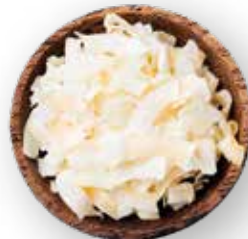
CHIPS DE COCO COCO EN HOJUELA 10 KG