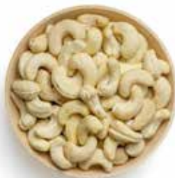
MARAÑÓN NATURAL CRUDO 22.68 KG