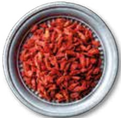
GOJI BERRY 20 KG