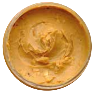
CREMA DE MARAÑÓN