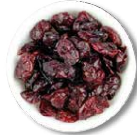
ARANDANOS DESHIDRATADOS 11.34 KG