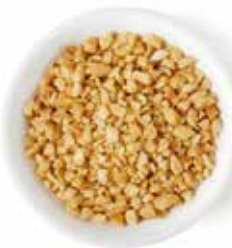
MANÍ TOSTADO TRITURADO 25 KG