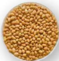
GIRASOL CROCANTE TIPO JAPONÉS 10 KG