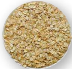
AVENA EN HOJUELAS 25 KG