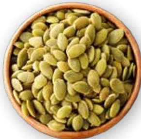
SEMILLA DE CALABAZA VERDE SIN TOSTAR 25 KG