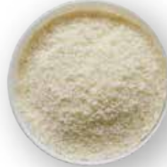
HARINA DE CENTENO 22.68 KG