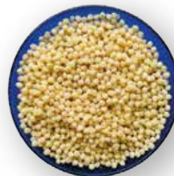
CEREAL EXTRUIDO MINI QUINOA 10 KG