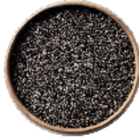
SEMILLA DE CHÍA 25 KG