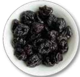
CIRUELAS PASAS 10 KG