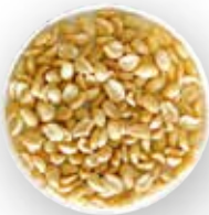
MANÍ PARTIDO SPLIT (PARTIDO A LA MITAD) 25 KG