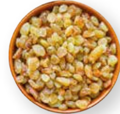
UVAS PASAS RUBIAS 10 KG