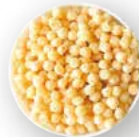
CEREAL EXTRUIDO DE QUINOA 7 KG