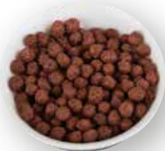
CEREAL EXTRUIDO BOLITAS DE CHOCOLATE 7 KG