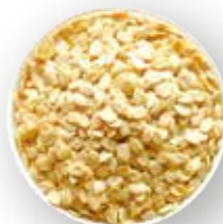
SEMILLA DE SANDÍA