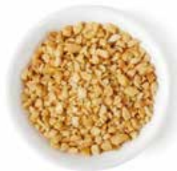
MANÍ TOSTADO ENTERO (MANÍ GRANA) 25 KG