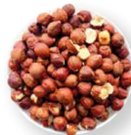
AVELLANA 10 KG