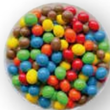
UVAS PASAS RECUBIERTAS DE CHOCOLATE DE COLORES 10 KG