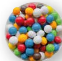
GALLETAS RECUBIERTAS DE CHOCOLATE COLOR SURTIDO 10 KG