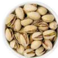
PISTACHOS 11.3 KG