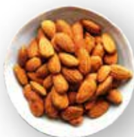
ALMENDRA TOSTADA 25 KG