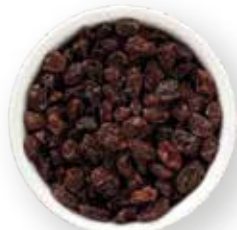
UVAS PASAS 10 KG