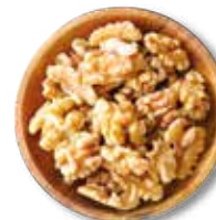
NUEZ DEL NOGAL 10 KG