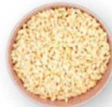
CEREAL EXTRUIDO ARROZ BLANCO 10 KG