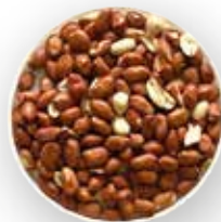
MANÍ CON PIEL 50 KG