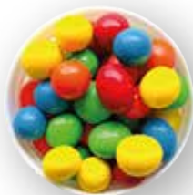
MANÍ RECUBIERTO DE CHOCOLATE DE COLORES 10 KG