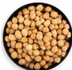
MANÍ CROCANTE CON AJONJOLÍ 10 KG