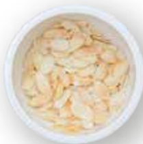
ALMENDRA LAMINADA 11.3 KG