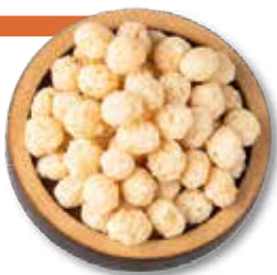
NUCLEOS PARA RECUBRIR 7 KG