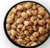
SACHA INCHI 25 KG