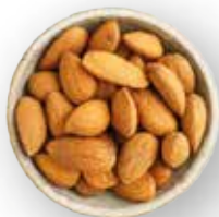
ALMENDRA ALMENDRA NATURAL 22.68 KG