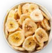
CHIPS DE BANANO DULCE 6.8 KG