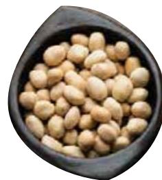
MANÍ CROCANTE TIPO JAPONES 12.5 KG