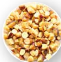
NUEZ DEL BRASIL BROKEN-A, BROKEN-D 20 KG