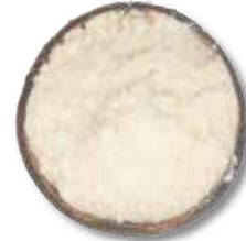
HARINA DE COCO 20 KG