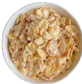
CEREAL HOJUELA DE MAIZ AZUCARADA 10 KG