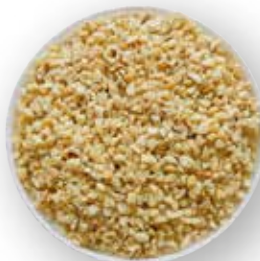
MARAÑÓN TRITURADO 22.68 KG