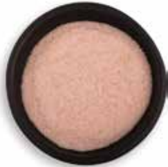
SAL ROSADA DEL HIMALAYA FINA 25 KG