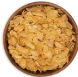
CEREAL HOJUELA DE MAIZ NATURAL 10 KG