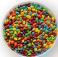
GIRASOL RECUBIERTO DE CHOCOLATE COLORES 10 KG