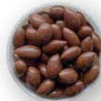
GIRASOL RECUBIERTO DE CHOCOLATE OSCURO 10 KG