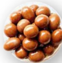
MANÍ RECUBIERTO DE CHOCOLATE OSCURO 10 KG