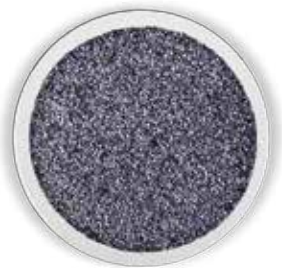
SEMILLA DE AMAPOLA TOSTADA 25 KG