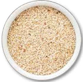
SEMILLA DE QUINOA BLANCA DESAPONIFICADA 25 KG