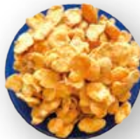
HABAS TOSTADAS 25 KG