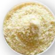
HARINA DE ALMENDRA 11.3 KG