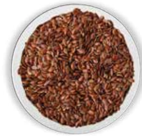
SEMILLA DE LINAZA 50 KG