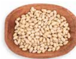
MANÍ BLANCHEADO 50 KG