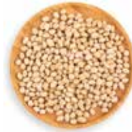
MANÍ CROCANTE TIPO JAPONÉS 10 KG