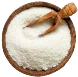
COCO RALLADO 25 KG