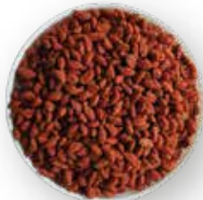
CEREAL EXTRUIDO ARROZ CHOCOLATE 10 KG