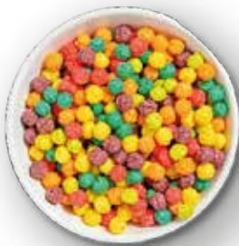
CEREAL EXTRUIDO BOLITAS FRUTALES 7 KG