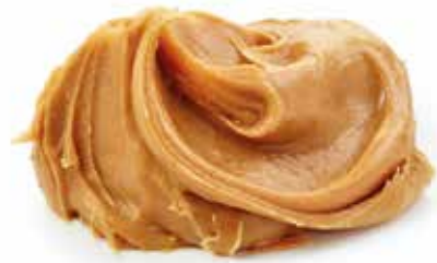
CREMA DE MANÍ