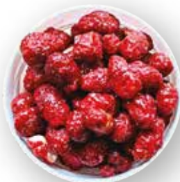
MANÍ CONFITADO GARRAPIÑADO 12.5 KG