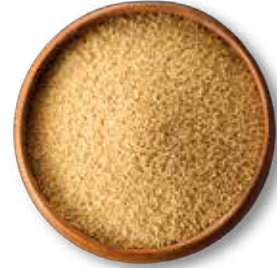
SEMILLA DE AMARANTO 25 KG