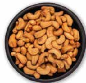
MARAÑÓN TOSTADO 22.68 KG