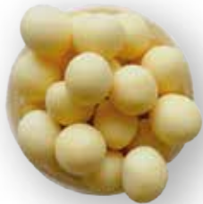
PRODUCTOS RECUBIERTOS DE YOGURT CON PROBIÓTICOS (UVAS PASAS, MANÍ CROCANTE, ALMENDRA Y ARÁNDANOS) 12 KG