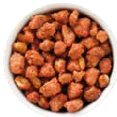
MANÍ CONFITADO CON Y SIN AJONJOLÍ 12.5 KG