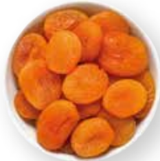
ALBARICOQUE 12.5 KG