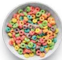
CEREAL EXTRUIDO ARITOS FRUTALES 7 KG