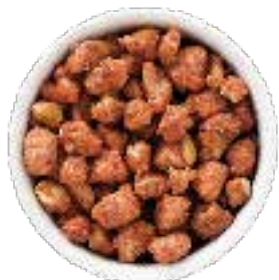
MANÍ GARRAPIÑADO 12.5 KG