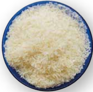
ARROZ BASMATI DE LA INDIA 25 KG