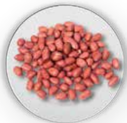
MANÍ CON PIEL JAVA 50 KG