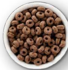
CEREAL DE QUINOA SABOR CANELA 7KG