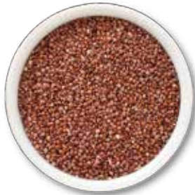
SEMILLA DE QUINOA ROJA 25 KG