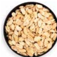
SOYA TOSTADA 25 KG