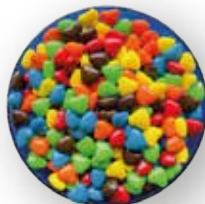
VALENTINES DE CHOCOLATE DE COLORES 10 KG