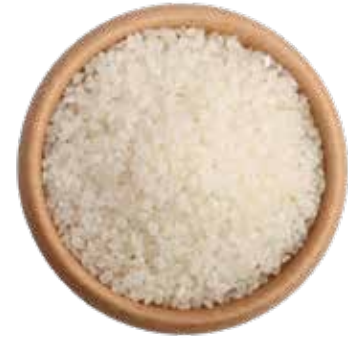
ARROZ JAPONICA 25 KG