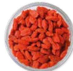
GOJI BERRY / BAYA DE GOJI