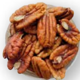
NUEZ PECÁN 13.6 KG