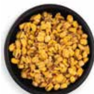
MAÍZ TOSTADO 25 KG