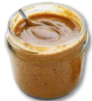
CREMA DE ALMENDRAS