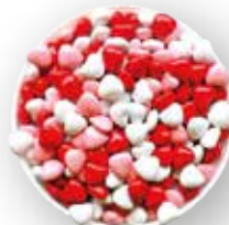
VALENTINES ROSADOS, BLANCOS Y ROJOS 10 KG