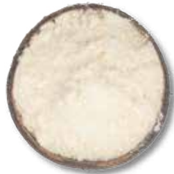
HARINA DE COCO 20 KG